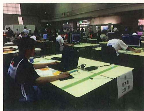
【真剣に取り組む選手達】